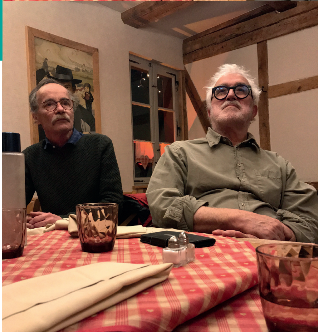
Soirée conviviale au restaurant du "Fer Rouge", sous les regards des artistes colmariens Hansi, Schoengauer, Bartholdi et Grünwald, peints par Jean Linnhoff.