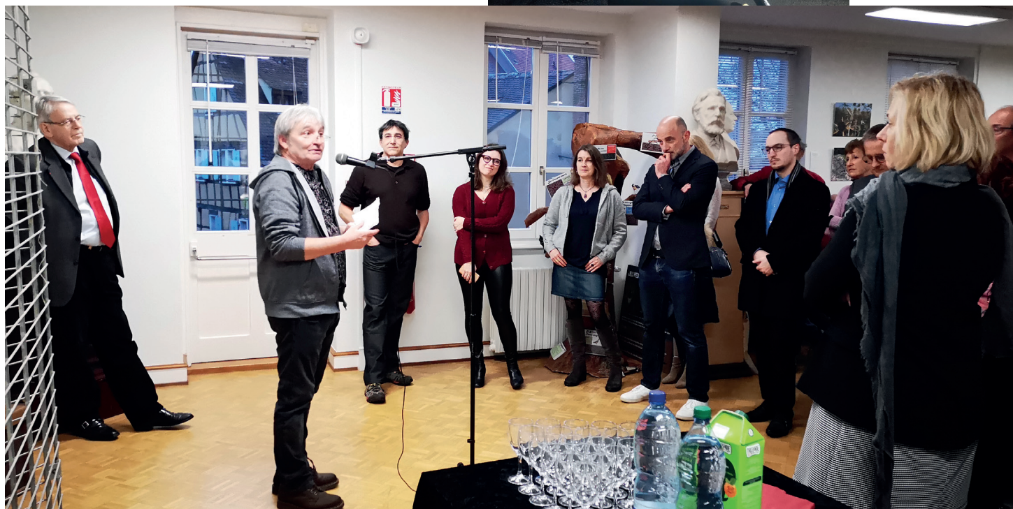
Visite du Musée d'Histoire Naturelle et d'Ethnographie et de Cartooning for Tree, séances de dédicaces et inauguration de l'expo.

En savoir plus : https://www.museumcolmar.org https://www.facebook.com/museumcolmar